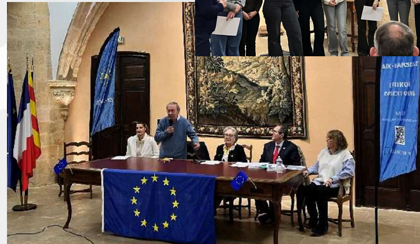
Vœux européens le 28 janvier 2026