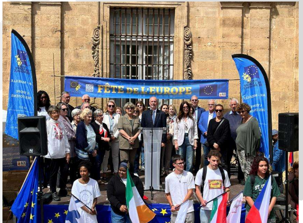
Fête de l'Europe 11 mai 2026