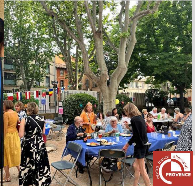
Grand Buffet Européen avec le CFAP 29 mai 2026