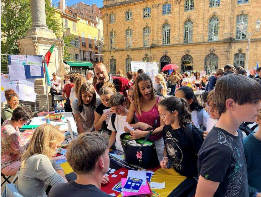
Journée Européenne des Langues 26 septembre 2025