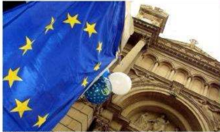
Aix fête l'Europe le lundi 11 mai, deux jours après la journée dédiée au Vieux Continent.