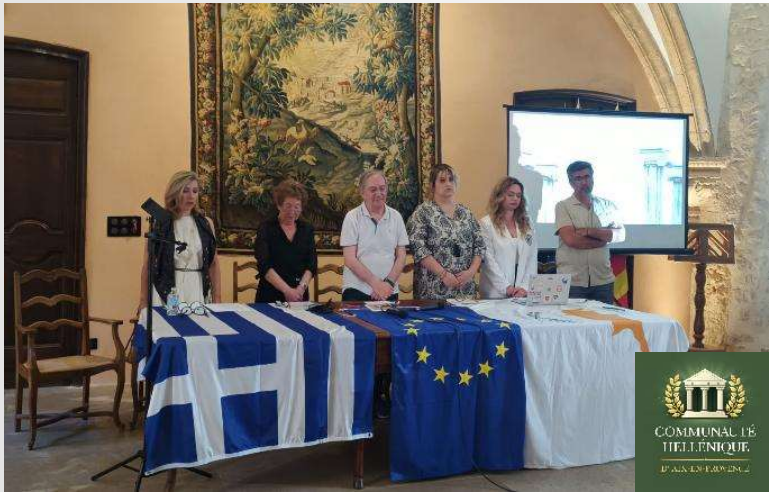
28 mai soirée culturelle grecque