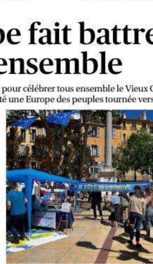
La place de la mairie aux couleurs de l'Europe, où stands et associations accueillent visiteurs et scolaires. PHOTOLIP

Les associations accueillent visiteurs et scolaires. PHOTOLIP