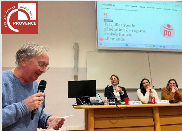
26 janvier : Génération Z